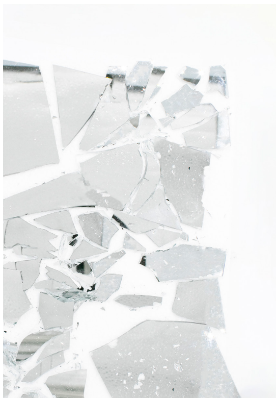
Normal Mirror - example of breakage